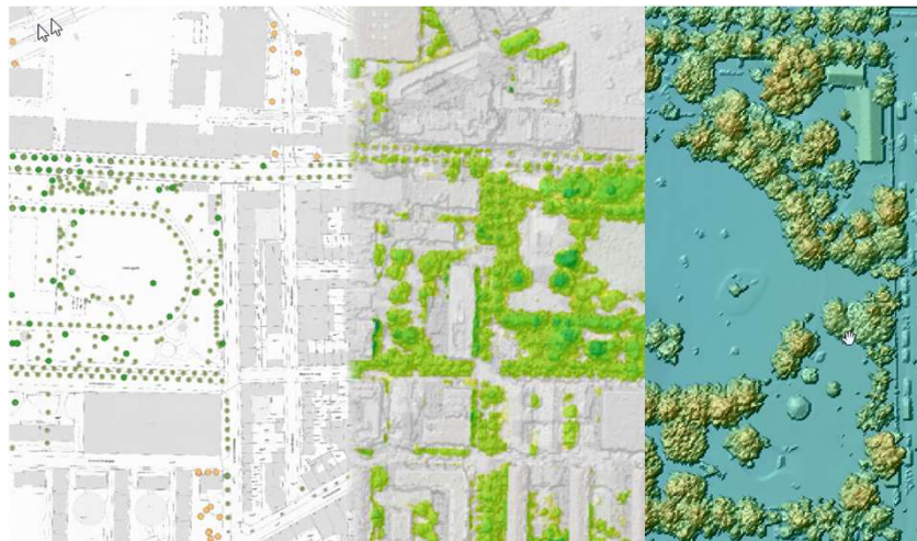
GeoViewer TBA - LiDAR (tiefbauamt-bs.ch)