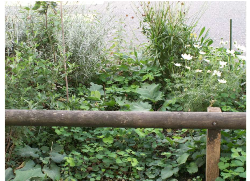
Baumpatenschaft, Birmannsgasse, Basel