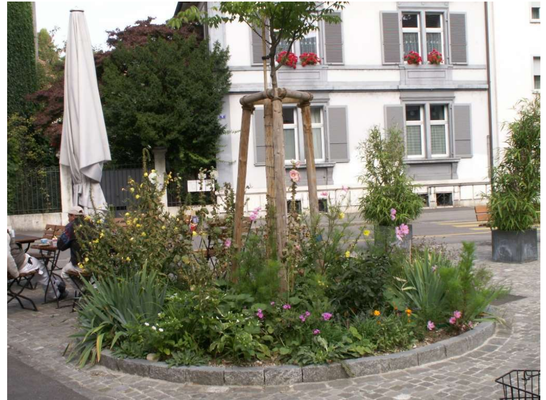
Baumpatenschaft, Birmannsgasse, Basel

« On protège ce qu'on aime, et on aime ce qu'on connaît » – Jacques Cousteau